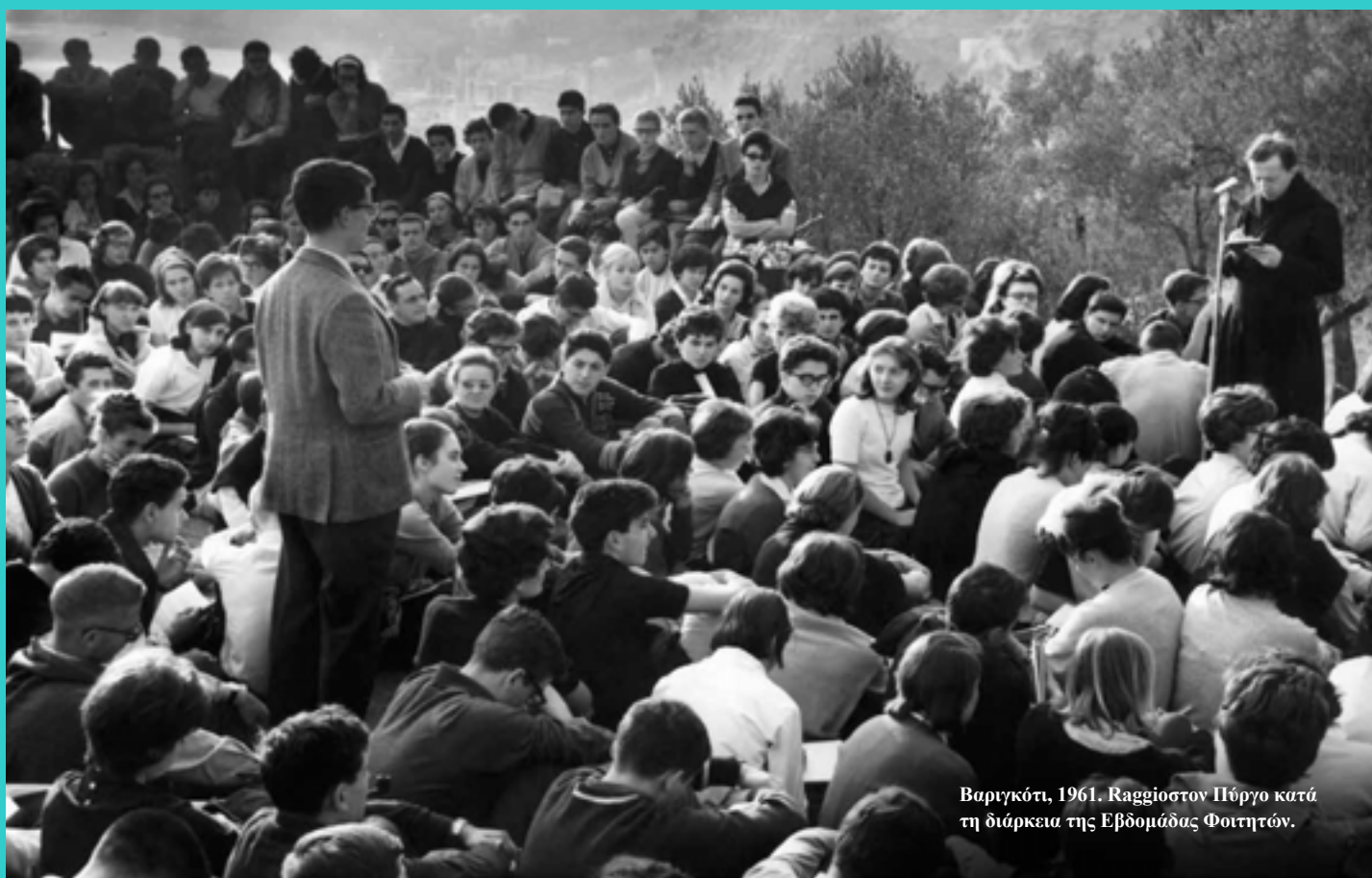
Βαριγκότι, 1961. Ραγίο στον Πύργο κατά τη διάρκεια της Εβδομάδας Φοιτητών.

αναγνώριζε για έναν πολιτισμό που είχαμε; (« Avvenimento e responsabilità », σ . VII).