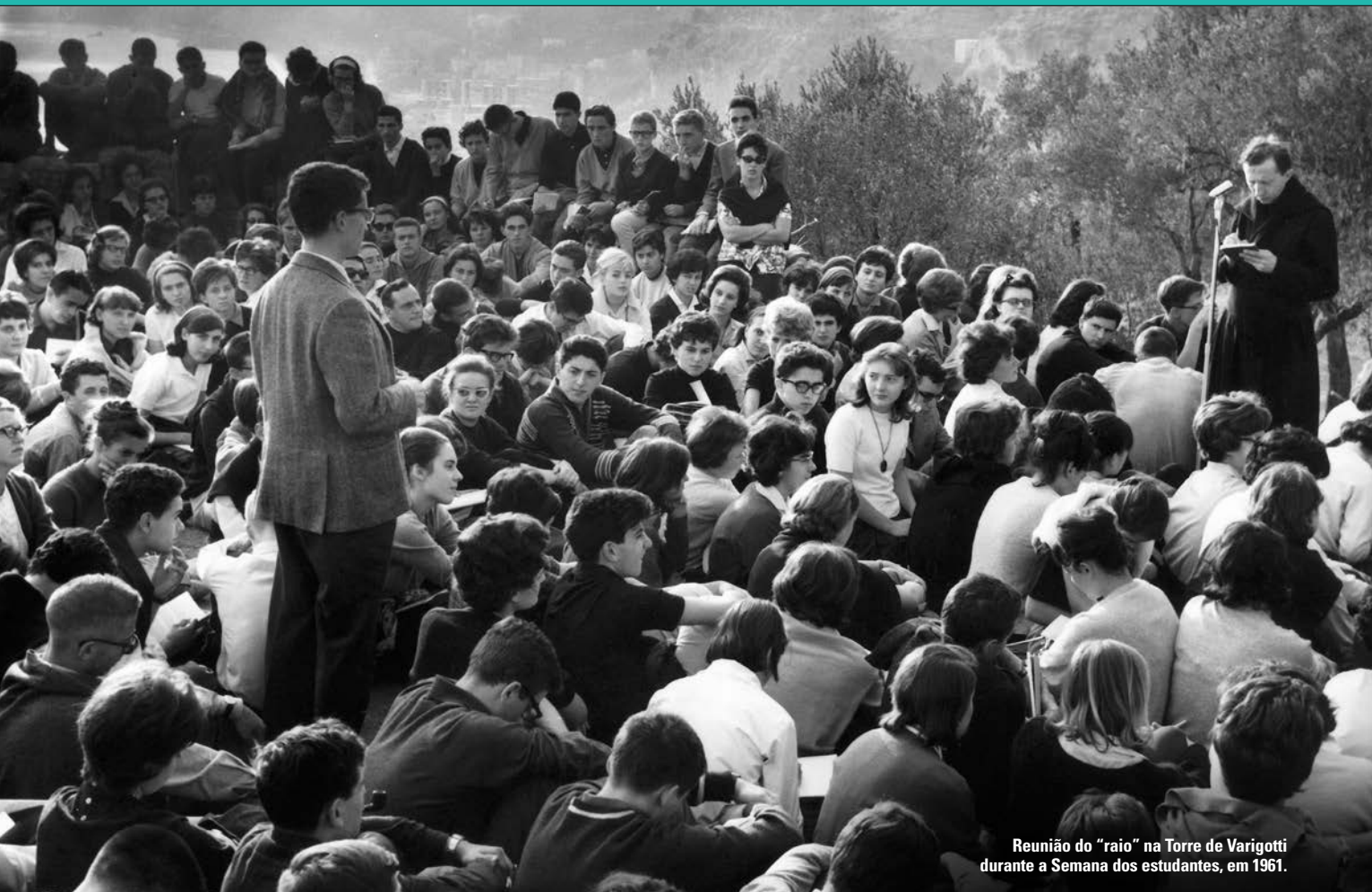
Reunião do "raio" na Torre de Varigotti durante a Semana dos estudantes, em 1961.

temos de andar por esta estrada, todos vocês que estão aqui, estão aqui porque foram chamados para esta estrada. Vão amar mais a sua mulher, vão amar mais os amigos, vão amar mais os filhos, vão saber que quer dizer ter piedade, vão saber que quer dizer perdoar, vão saber que quer dizer sacrificar-se para construir, para que os outros fiquem melhores, vão saber ser humanos, serão mais humanos. 'Quem me segue terá a vida eterna', que é Ele, a relação com Ele" (L. Giussani, In cammino. 1992-1998 . Milano: BUR, 2014, p. 226-227). Dom Giussani não se afasta nem uma vírgula! A vida eterna é Cristo, a salvação é Ele. E só permanecendo ligados a Ele nesta estrada é que podemos ver florescer as relações, construir, estar abertos aos necessitados, ser cada vez mais humanos.